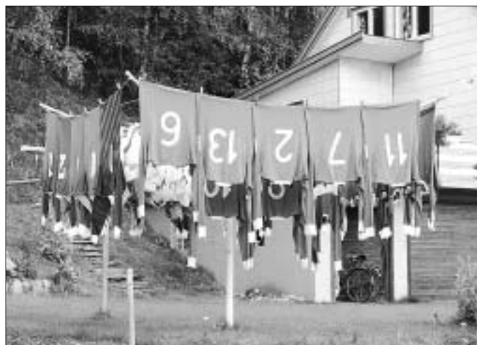
1985, 27. september: Bilde nummer 5000 i fotoarkivet. Denne vasken har verkeleg fått henge nokre dagar no i styggeveret. Det er Solbjørg Berli (Bilde nummer 4966 i arkivet) som steller med vaskinga for VIL. Solbjørg er kanskje ein av dei likaste støttespelarane laget har.