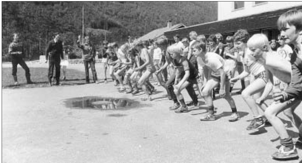
1981, 5. juni: Skuleidrettsdagen på Valldal skule. «Dagen begynte med regn og enda med sol. Her legg siste feltet ut på 800 meteren. Topp innsats!» kommenterer Storfjordnytt på førstesida. Andre saker på denne sida var første cruiseskip i Geiranger og: «Slutt på laksefiske i Valldal?» Lakseparasitt var oppdaga i elva.