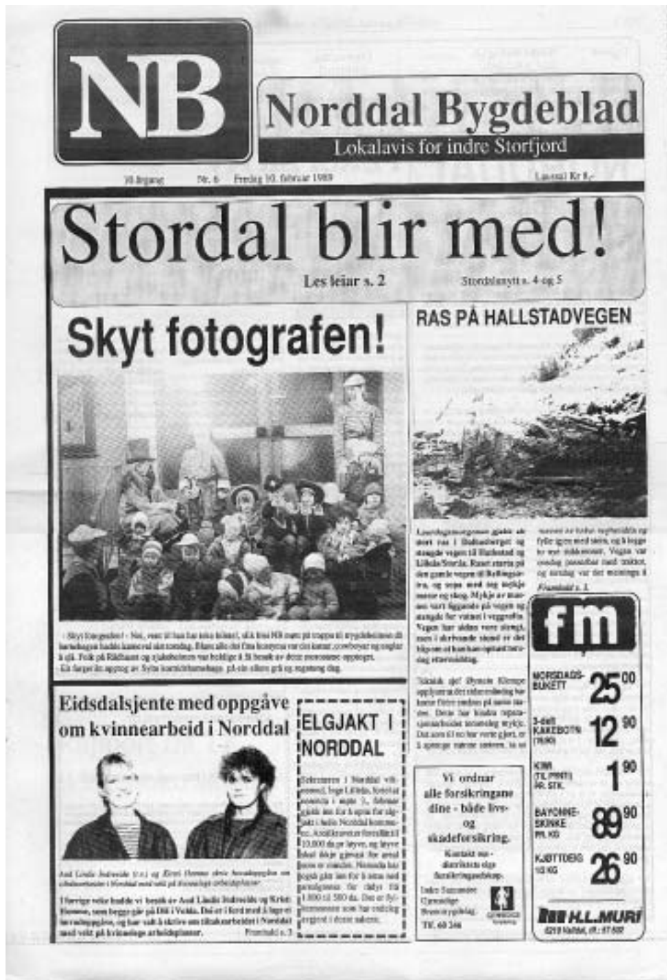
Forsida på Norddal Bygdeblad 10. februar 1989

Derfor; til lukke med dei 20 som har gått - og til lukke med dei 20 som kjem!