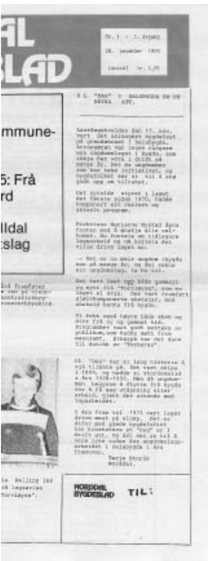
Faksimile av førstesida til første utgåve av Norddal Bygdeblad 28. november 1979.