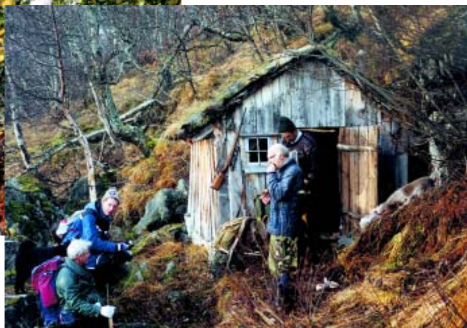
Jaktlag på Tverrafjellet.

TEKST: BJØRN HELGE NYGÅRD