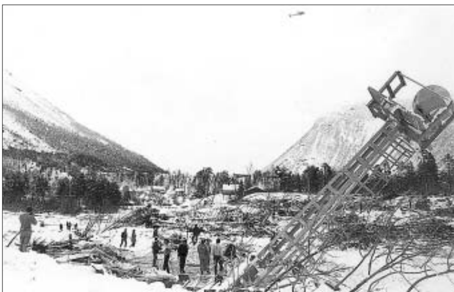
1982, 23. april: Fonnpåska. Førstesidesaka i denne utgåva etter påske fortel om medie-Norge som krinsa rundt bygdene våre. Det var Jamtefonna som gjekk. Det store snøfallet førte også til mange andre problem.