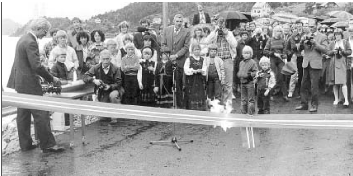
1982, 14. august: Opning av vegen til Tafford. Storfjordnytt hadde ferie då vegen vart opna, men første nummer etter dette seier førstesida. «Tafford kjem». 30. oktober 1981 var det gjennomslag i tunnelen. Sjølve opninga var 1. juli 1982 ved statsråd Vidkun Hveding.