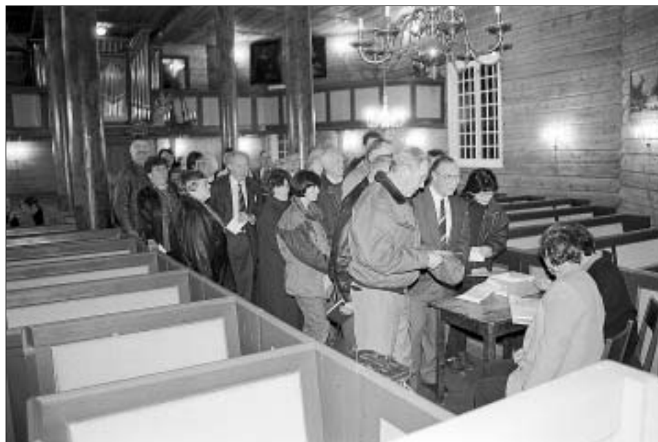
1996, 18. januar: «Høg temperatur i prestebustadsaka» er overskrifta på førstesida. Her vert det røysta om kvar presten skal bu. Biletet er frå kyrkjelyds-møte med avrøysting i Norddal.