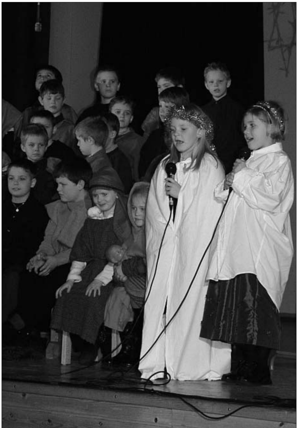
Frå oppsetjinga av julespelet som dei yngste elevane på skulen stod for.

Born frå småskulen tok del i eit stort syngespel om juleevangeliet under avslutninga på Valldal skule torsdag. Under avslutninga var det mange foreldre og slektningar som kosa seg saman med borna i gang rundt juletreet, program og matpause med medbrakt mat i kantina.