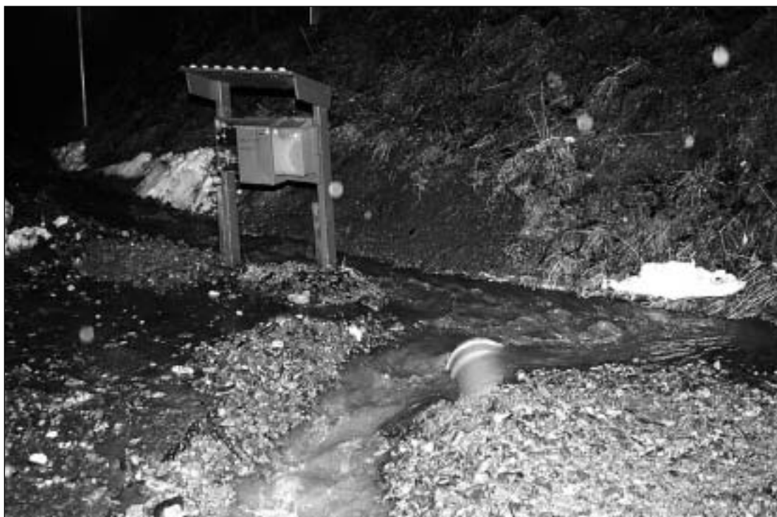
Det var mest uråd å hente posten utan vadarar.

Det vert sal av mat og drikke heile dagen, lynlotteri og dans om kvelden i regi av fotballgruppa. Cupen har blitt ein treffstad for vener og kjende i jula, og det er ikkje nødvendig å delta i aktivitetane for å ta ein tur innom, melder kulturkonsulenten i Stordal.