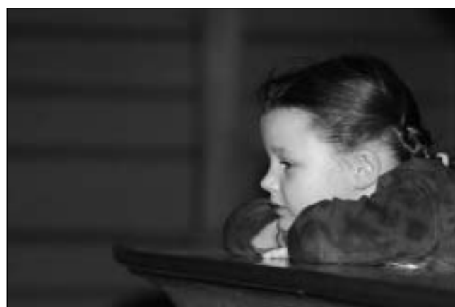
Det er godt å kunne lene seg på gallerirekkverket og berre nyte musikken, ekstra kjekt når det er så mange av utøvarane ein kjenner.