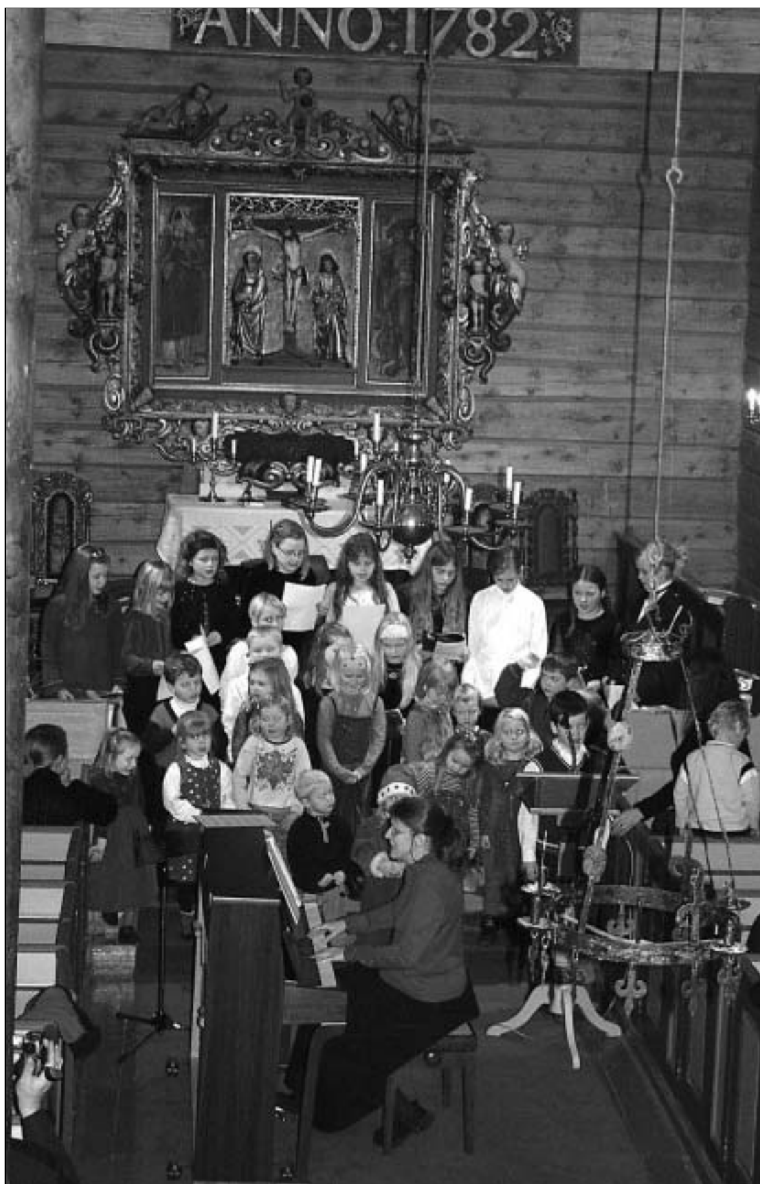
Barnekoret i Norddal kyrkje.