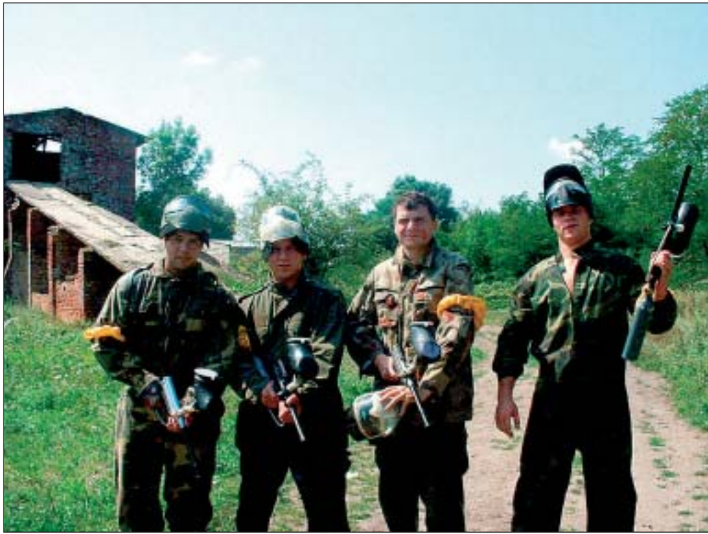
Paint-ball var ein av dei populære fritidsaktivitetane som deltakarane mora seg med i varmen.