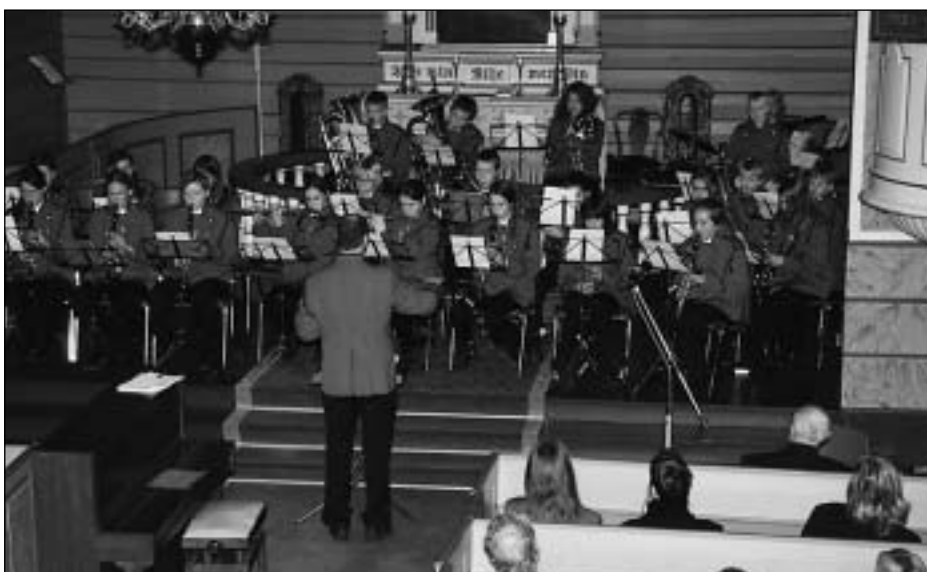
Det var flott å høyre då både Valldal songlag og elevar frå skulen i Valldal song saman.