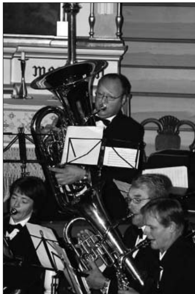
Nokre av medlemmene i Valldal Hornmusikklag.