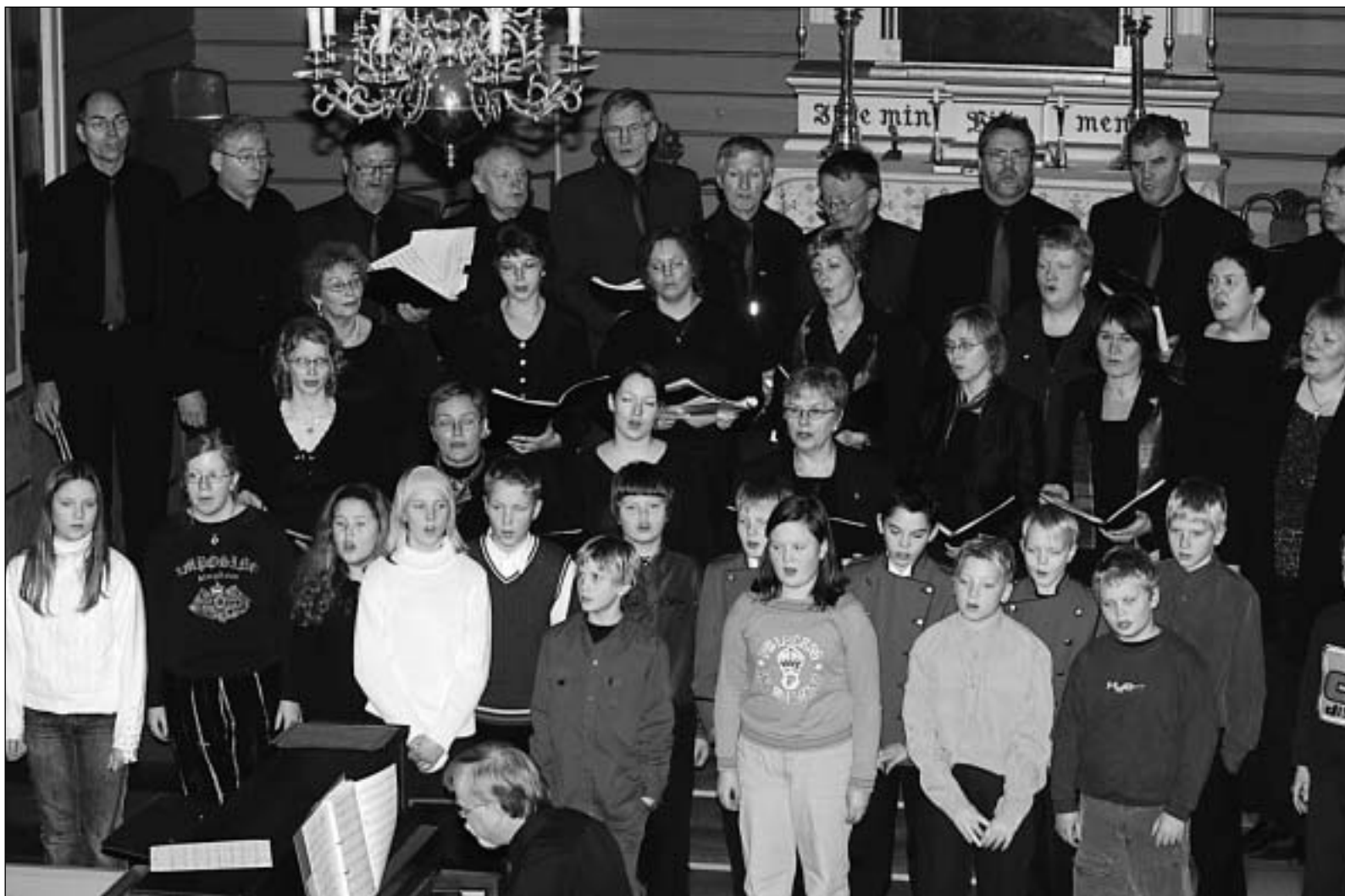
Det var flott å høyre då både Valldal songlag og elevar frå skulen i Valldal song saman.