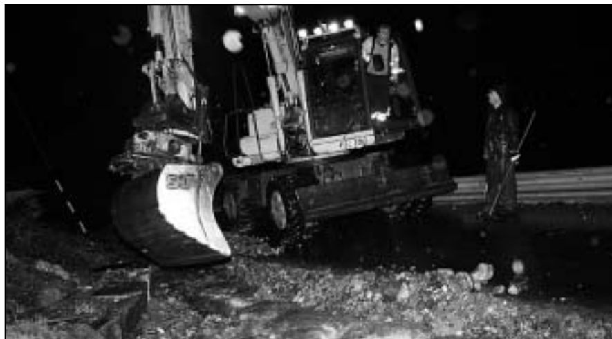
Det måtte gravast ei større grøft langs Hovslia for å leie vatnet unna. Grave-maskina frå Busengdal tok grovarbeidet.